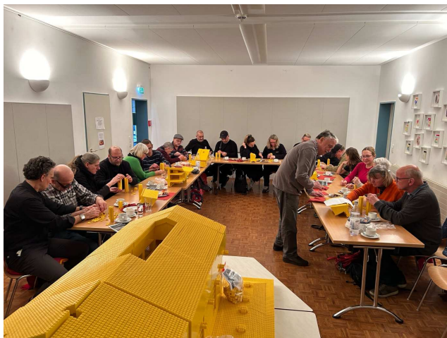
(Foto: Teilnehmer und ihre Assistenten und Begleiter saßen an der U-förmigen Tafel)

Anschließend trommelte ich auf einer spanischen Kistentrommel „Cajón“ aus Holz. Es wurde laut, laut, laut, jeder Schlag wie ein Hammerschlag. Alle konnten diesen Musikklänge gut spüren. Applaus ... es hat Spaß gemacht. Alle durften sich setzen. Wir tranken etwas und probierten die Plätzchen. Dann erklärte ich ihnen gebärdend, wie wir uns mit LEGO-Steinen beschäftigten. Alle Assistenten konnten die Gebärdensprache verstehen und taktil an die taubblinden und höresehbehinderte Menschen weitergeben. Für Taubblinde ist es schwer, LEGO-Figuren zu bauen, weil sie unbedingt einer bildlichen Bauanleitung folgen sollen. Wir können mit bildlichen Bauanleitungen wegen der Taubblindheit nichts anfangen. Alternativ kann man aber mit den Steinen und Platten von Lego frei bauen, nach der eigenen Vorstellung, nicht nach einer Anleitung. Als ich in meinem Beruf nicht mehr arbeiten konnte, hatte ich viele Steine und Platten erworben, um genau dies zu tun. Bauen nach meiner Vorstellung.