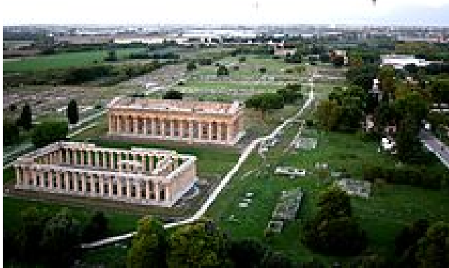
(Foto: Hera-Tempel und Poseidon-Tempel im Vordergrund, hinten der Athene-Tempel in Paestum)

Wir stellten uns nun alle mitten in der U-förmigen Tafel vor dem Tempel auf. Wir tanzten dreimal in einer Polonaise um den riesigen Tempel. In der ersten Runde übten wir die Orientierung um die drei Tische, in der zweiten Runde tasteten wir das große Dach des Tempels ab und in der letzten Runde dann das Fundament des Tempels. Auf diesem Fundament sollten nun 28 Säulen aufgesetzt werden. Zum Schluss der dritten Runde erhielt jeder eine Tüte mit 288 Steinen und zwei Zettel mit Namen aus der Mythologie. Diese Zettel waren die Lose für eine geplante Verlosung.